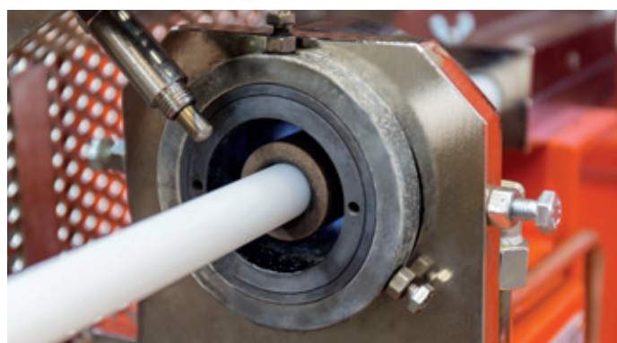
Dispositivo di rigatura / Rifling die system

Another advantage offered by the line supplied by AMUT is the possibility to produce bioriented pipes of small diameter (11 mm) necessary for the smallest gauges (gauge 36 - .410), otherwise produced by means of rigid and expensive injection technologies. The extrusion line is very easy to operate and also very flexible. The change of product can be made in one hour only.