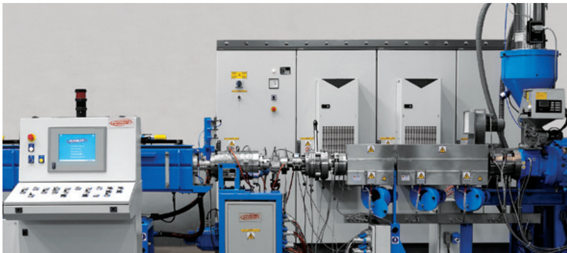
Estrusore EA 48 / EA 48 extruder