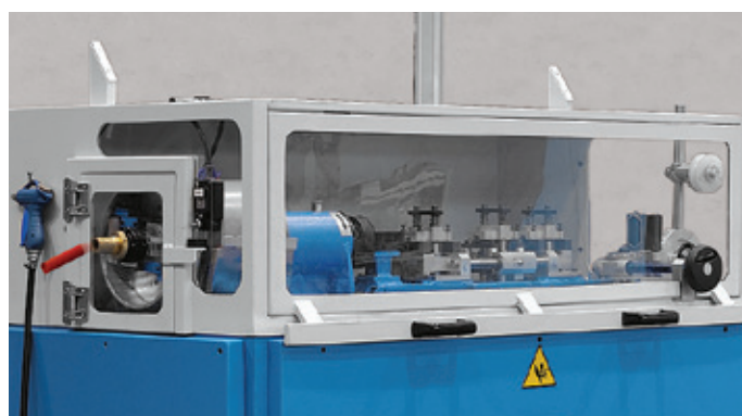
Taglierina Planetaria / Planetary cutting unit